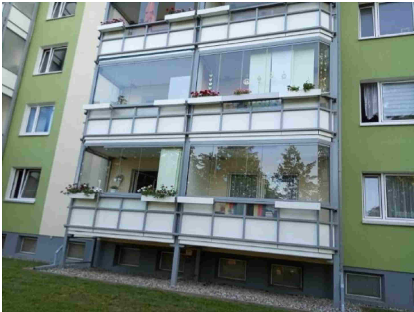
Централізоване застелення балконів після реконструкції в м. Росток, Німеччина