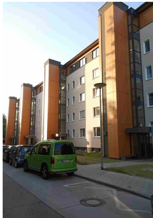
Ліфт панельного будинку після реконструкції м. Росток, Німеччина

Визначимо основні шляхи модернізації «хрущовок»: