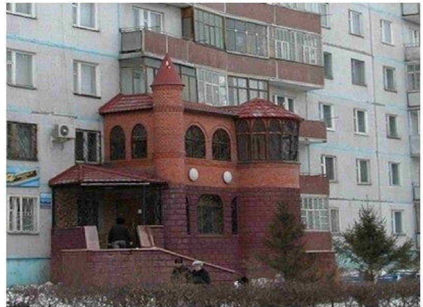
Незаконна добудова в Києві

ної реновації кварталів міста з урахуванням фінансових витрат.