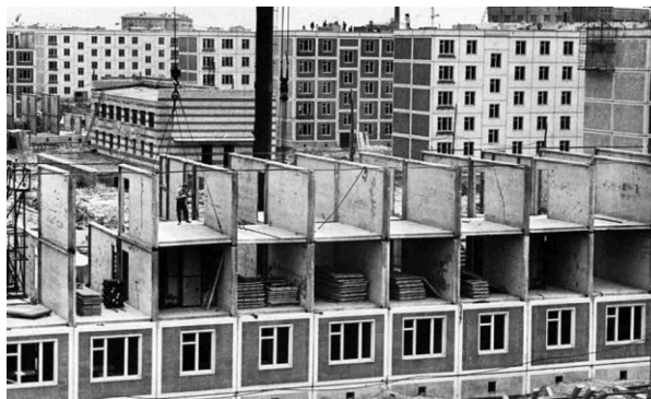
Будівництво «хрущовок» в Києві

максимальне спрощення фасаду і покрівлі; дах поєднано зі стелею п'ятого поверху; три-чотири квартири на поверсі; переважають одно- та двокімнатні квартири малої площі; висота стель 2,48...2,6 м. Особливості планування квартир: у дво- і трикімнатних квартирах вітальня прохідна; вкрай мала кухня площею 4,6...6 кв.м; суміщений санвузол площею близько 2 м 2 .