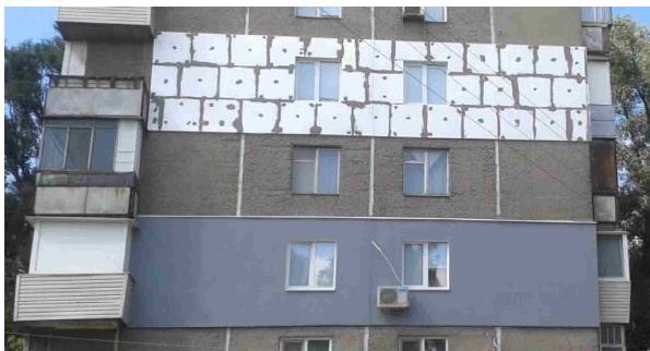
Хаотичне утеплення фасадів у Львові

Оновлення генпланів та концепцій розвитку міст, здійснене на початку 1990-х років, сформувало дві основні тенденції реконструкції «хрущовок» – одним із рішень є знос радянських житлових будівель для побудови сучасних типів житла в центральних районах, альтер-нативою є суттєве оновлення житлового фонду. Відповідно, необхідно формувати програму комплекс-