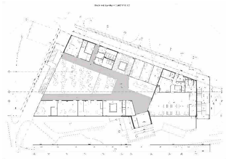
Рис.1. План на відмітці 0.000