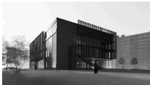
Рис.5. Вигляд з проїзду Нахимова