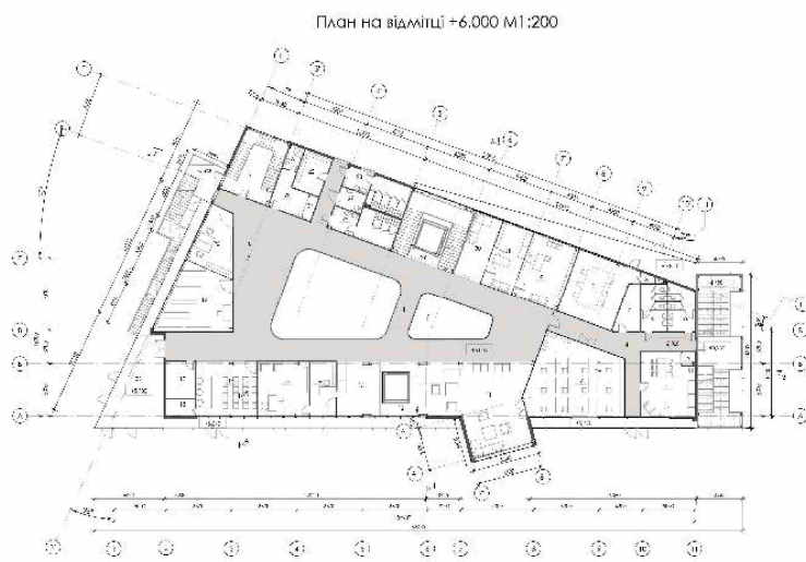
Рис.2. План на відмітці 6.000