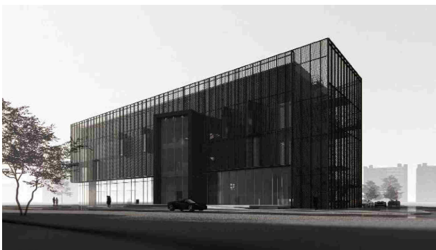
Рис.4. Вигляд з проспекту Нахимова

Проект соціального офісу з приймальною міської голови отримав перемогу у номінації Trimble за найцікавішу реаліза-